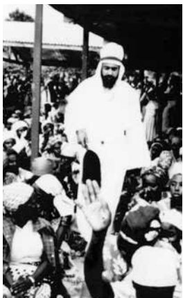
Maitreya i Nairobi juni 1988

April 1988: I april 1988 begynte Maitreyas åndelige lære, så vel som en rekke forutsigelser om verdensbegivenheter, å bli frigitt til pressen gjennom en nær medarbeider i det asiatiske samfunn.