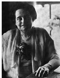
Alice A. Bailey

BC: Den tidløse visdomslæren er like gammel som menneskeheten selv. Dette er den læren som kommer fra en gruppe mennesker som har utviklet seg videre, forbi det rent menneskelige stadium, og som har trådt inn i det neste riket, det åndelige riket. De er Visdommens Mestre og Medlidenshetens Herrer, menn og kvinner som oss som har utvidet bevisstheten til å inkludere de åndelige plan. Det finnes et stort antall av disse opplyste menneskene på vår planet som i utallige årtusener har holdt til i avsidesliggende fjell- og ørkenområder. Fra tid til annen gir de ut aspekter av sin lære for å opplyse oss, i den grad vi kan absorbere og bruke det.