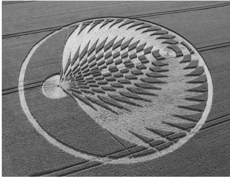
2. Uffington Castle, Oxfordshire, UK, 8 July 2006.