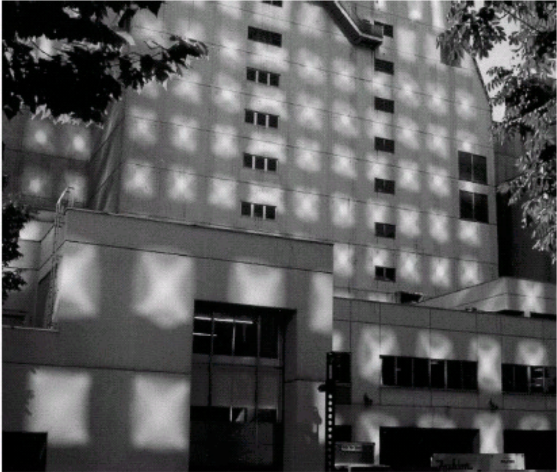
Lysmønstre på stormagasinet Tokyu i Sapporo, Hokkaido, Japan.