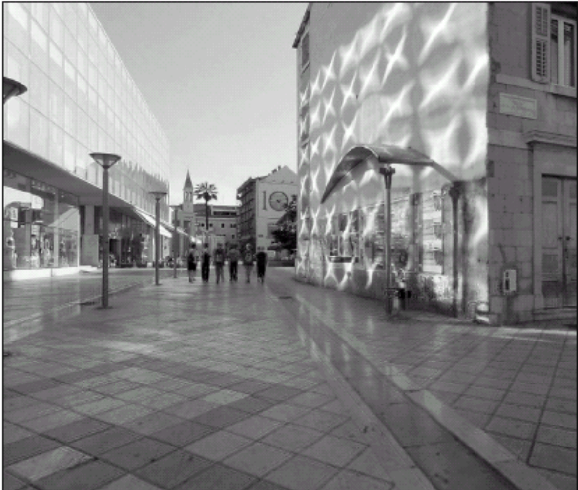
Lysmønstre på en bygning i sentrum av Spli, Kroatia.